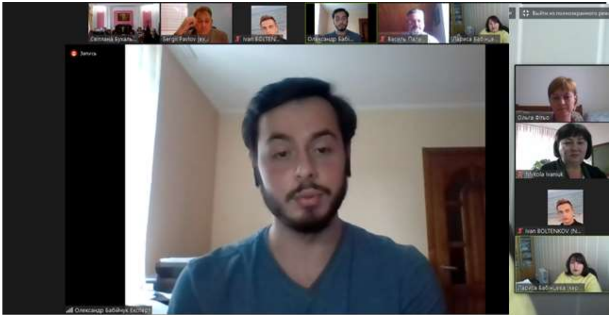
Зустріч 9. Фінальний брифінг.